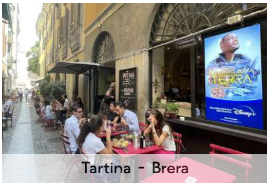
Tartina - Brera