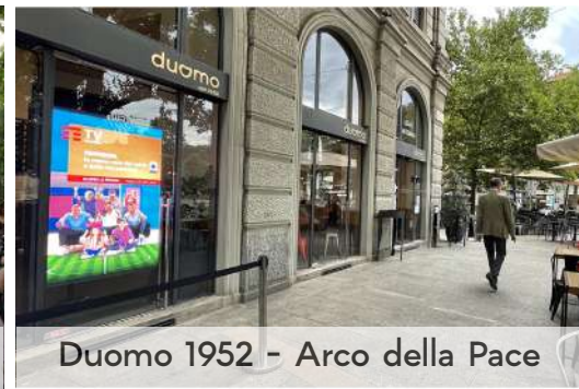
Duomo 1952 - Arco della Pace