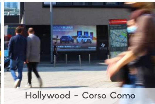
Hollywood - Corso Como