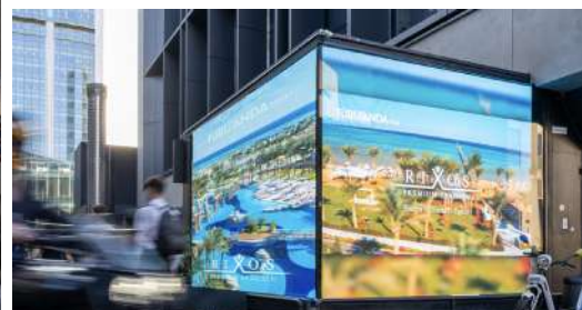
Piazza V Giornate