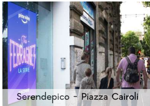
Serendepico - Piazza Cairolì