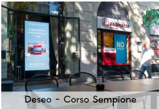
Deseo - Corso Sempione